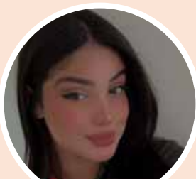
Ana V&P Paracambi