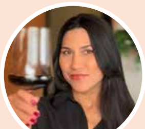
Dalila V&P Balsas