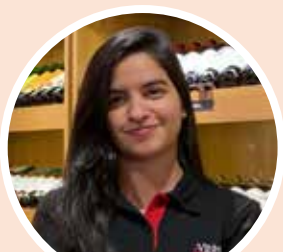
Clara V&P Barra da Tijuca